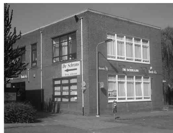
De Schrans naast de kerk.