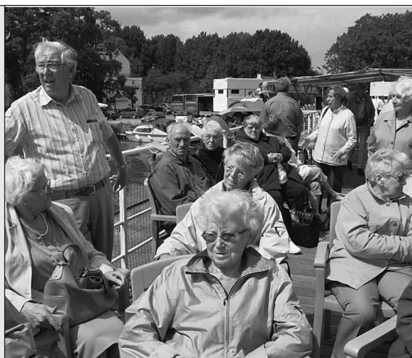
Met ziekenzorg op reis

Wie zich geroepen voelt om deze werkgroep te vervoegen kan zich aanmelden bij André Helderweirt , Pieter Van Malderenplein 4, Edegem, 03/449.90.33